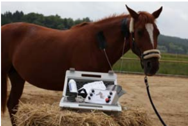
Verspannungen der Halsmuskulatur. Mit einem 4er Kabel können beide Seiten therapiert werden.