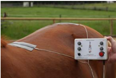
Problemen der Wirbelsäule, Verspannungen.